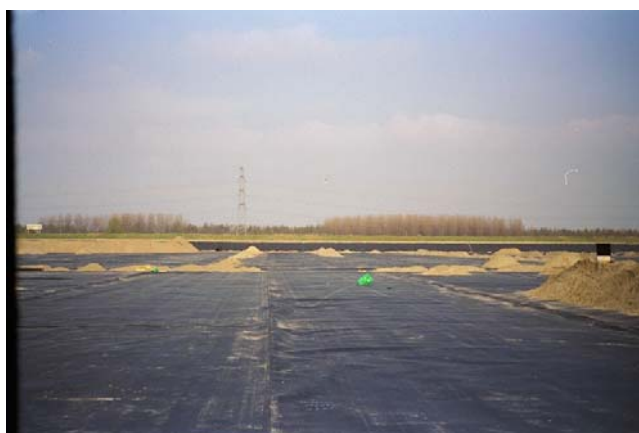
Stortplaats Midden Zeeland