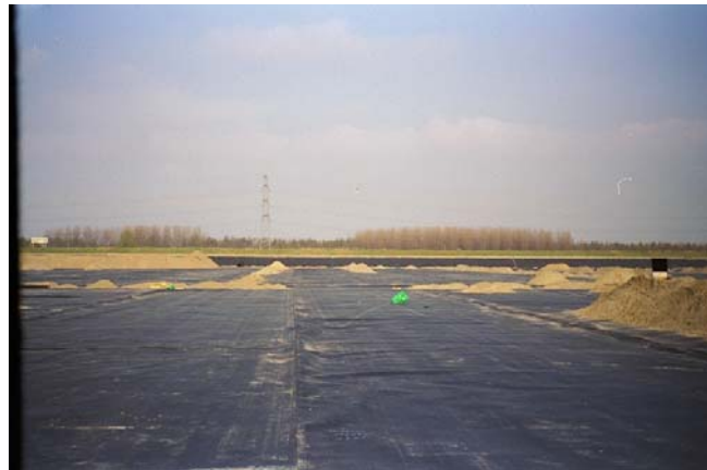
Stortplaats Midden Zeeland